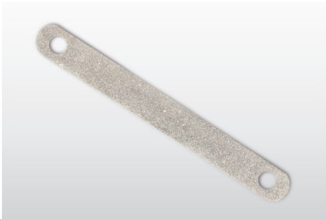
Figura / Figure 1