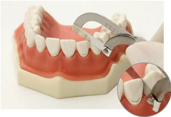
Figura / Figure 3