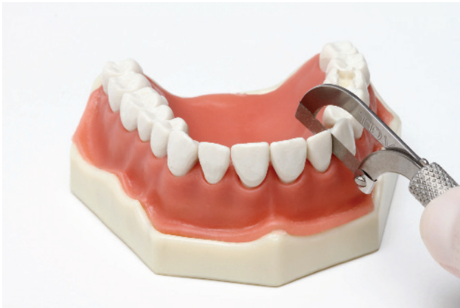
Figura / Figure 3