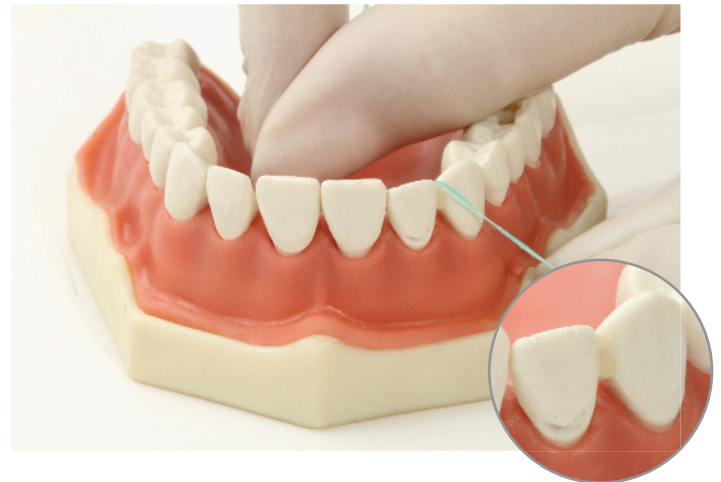
Figura / Figure 2