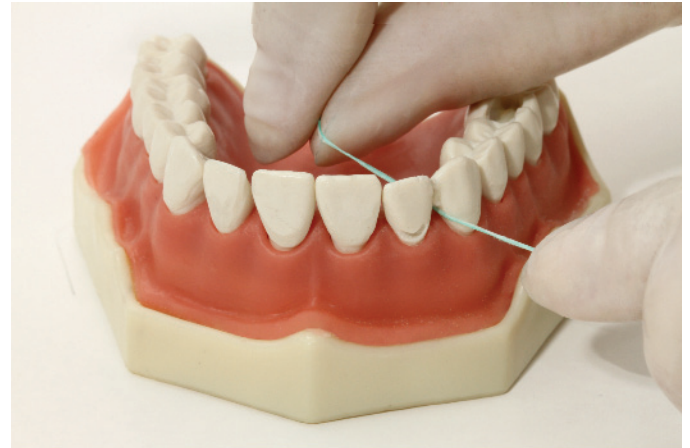
Figura / Figure 4