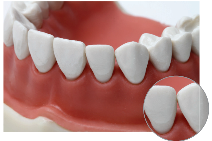
Figura / Figure 2